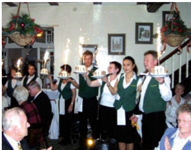
Ein Einmarsch, wie auf dem Traumschiff

Den Abschluss des Tages krönt dann die Busfahrt durch das vorweihnachtlich geschmückte und erleuchtete Hamburg. Ein herzliches Dankeschön gilt all denen, die mit Ideen und Taten bei der Gestaltung und der Durchführung dieses Festes dazu beitragen, damit es immer wieder unvergesslich bleibt.