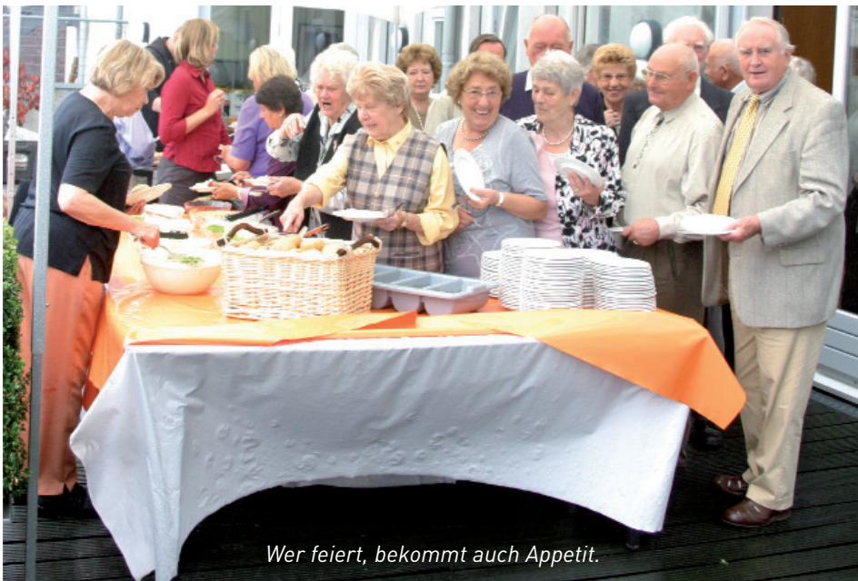
Wer feiert, bekommt auch Appetit.

Nicht vergessen, in 5 Jahren ist wieder Geburtstag !!!!!!!