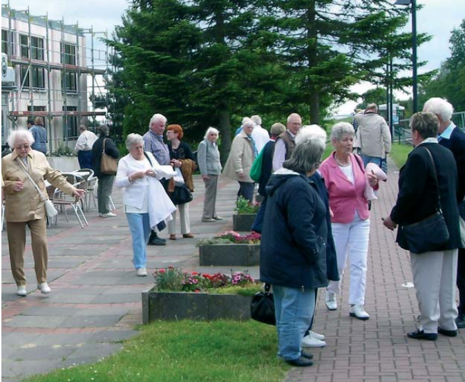
Nach dem "Eiderstedter Büffet"

Auch das war wieder ein schöner, erlebnisreicher Tag, den wir nicht aus unseren Erinnerungen streichen möchten.