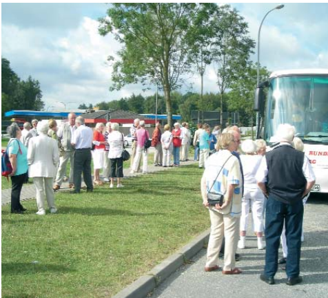
Eine kurze Rast auf dem Weg nach Travemünde

In unserem Programm sind dieses Jahr noch die Ausfahrt nach Büsum, die Besichtigung der Hamburger Hochbahn, die Vorträge über die Neugestaltung des Bereiches um den