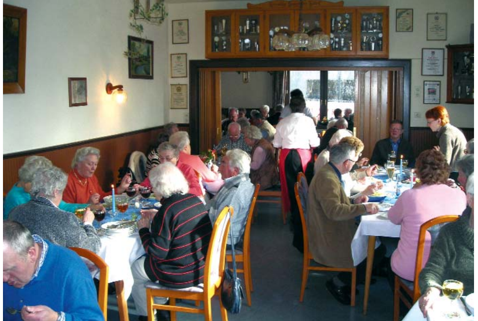
Gemütliches Beisammensein in Westebahnhof.

Im April haben wir dann das Brauhaus in Vielank besucht, wo wir zu Mittag aßen und das schmackhafte, selbst gebraute Bier probierten. Anschließend haben wir den Töpferhof Hohenwoos