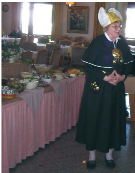
Die Chefin erklärt das Eiderstedter Büffet

Sicherlich werden wir später noch einmal dort einkehren, so gut hat es uns allen gefallen. Abgerundet wurde dieser Tag mit der Besichtigung des Eidersperrwerkes, wo gerade die Möwen brüteten und manchen zu nahe kommenden mit Sturzflügen angriffen. Mitte Juli starteten wir dann nach Bad Zwischenahn. Wenngleich die Hin- und Heimreise auch recht lange dauerte, so wurden wir doch durch all das Schöne dieses Ortes entschädigt. Eine Dampferfahrt auf dem Zwischenahner Meer war ein Erlebnis. Wer wollte, konnte im weit über die Grenzen hinaus bekannten Restaurant "Spieker" in urgemütlicher Runde das Ritual des Aalessens genießen.