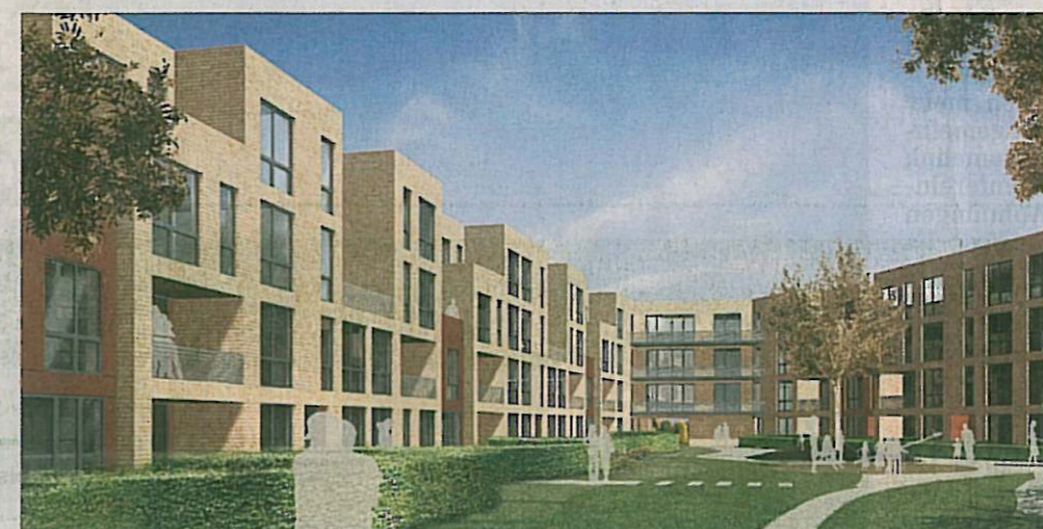
Die Baugenossenschaft Dennerstraße-Selbsthilfe errichtet nach Plänen des Hamburger Architekturbüros KBNK am Poppenbütteler Berg 54 Wohnungen und vier Stadthäuser. Die Einheiten werden angeboten zu einem Quadratmeterpreis von 8,50 Euro.

KBNK hat auch den Wettbewerb gewonnen, den die Baugenossenschaft freier Gewerkschafter (www.bfgg.de) zur Bebauung eines von der Liegen-